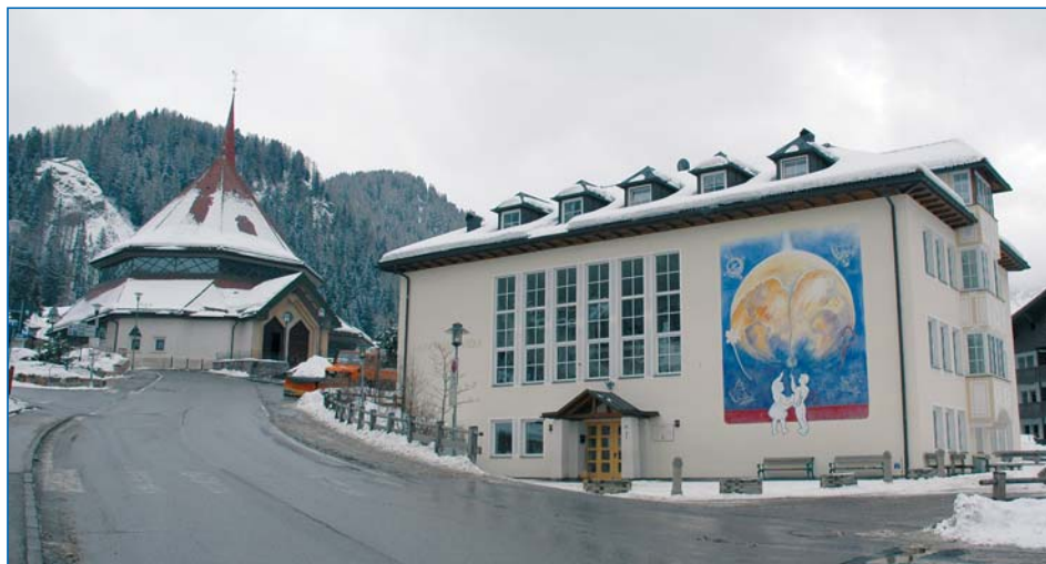
L'ampliamento della scuola elementare, prevede una spesa di Euro 1.147.528,90

nes", è stata accordata la servitù di tollerare la costruzione a una distanza dal confine inferiore a quella legale . Per la servitù, che grava un'area di 5 mq., è stato chiesto un corrispettivo di 935,00 Euro.