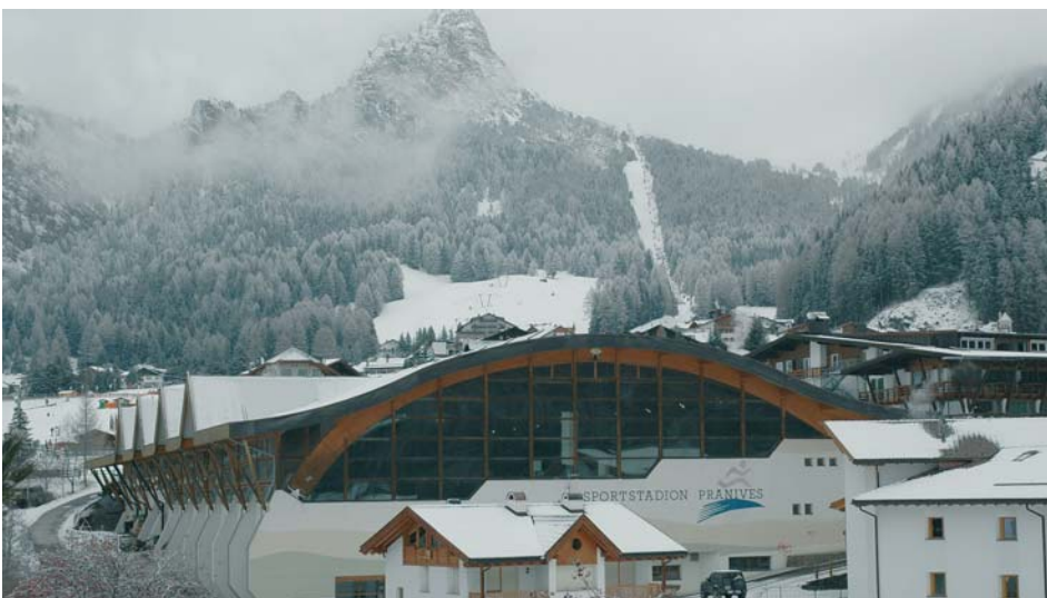
Le perdite della "Pranives S.r.l., accumulate nel corso degli anni ammontano a Euro 53.398,00.

Il piano viene ora trasmesso alla Giunta provinciale, che adotterà le determinazioni finali.