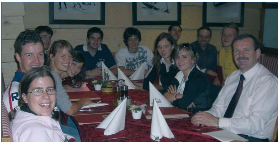
La festa de chèi de 18 ani ie fineda via cun na cèina

Ai jèuni val nia me de bujèn de scri dant duvieres, ma nce de judé a purté inant proiec a chèi che i possa créier y per chèi che i possa se mpeniè. L bon zitadin muessa uni crià pian via da na bona educazion. La generazion plu de tèm muessa ti dé i strumènc ajache i proiec de chisc jèuni "mèt eles". L'aministrazion de chemun ie ntenzioneda a se to a cuer i jèuni de nosc luech, chisc sarà nosc dauni. L ie inò stat na bela ancunteda y propi chèsc cuntat diret ie scialdi mpurtant per scuté su i debu-jèns, la propustes y la idées di jèuni de nosc luech.